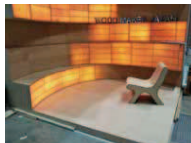
Youtube動画配信によるイメージ戦略

世界的なコロナ禍の状況で、『e.wood+』の特許取得済であるアメリカ、EU、中国、香港に販売するため、現地でのイベントに出展ができないことから、動画広告を活用したマーケティングリサーチを実施した。また、試作品開発のための打合せを現地とオンラインで行い、販路拡大に向け、取り組んでいる。店舗での直接販売だけでなく、B to B、B to C問わず、ネットショッピングのためのウェブサイト構築、あらゆるチャンネルを活用してお客さまとのつながりを持ち、世界市場を狙う。